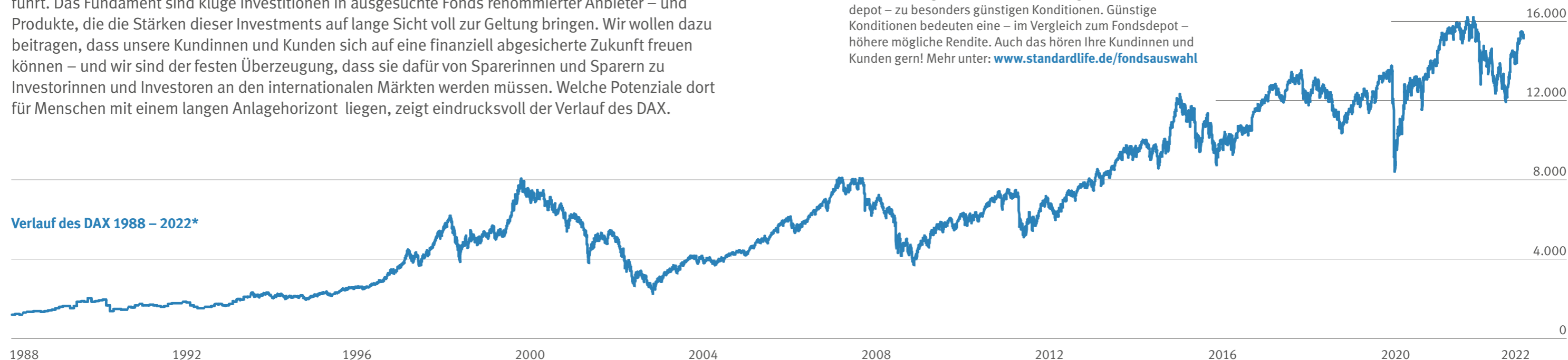
Verlauf des DAX 1988 – 2022*

Rendite macht glücklich. Sie lässt sich im Laufe der Zeit in vieles ummünzen: in Luxus, gutes Essen, eine neue Uhr, ein neues Auto. Wenn wir von Standard Life uns auf Rendite fokussieren, geht es uns aber in erster Linie um die langfristige materielle Sicherheit unserer Kundinnen und Kunden: Sicherheit macht nämlich noch glücklicher! Wir sind überzeugt davon, dass der beste Weg zu einer finanziell abgesicherten Zukunft – und einem auskömmlichen Ruhestand – über die internationalen Kapitalmärkte führt. Das Fundament sind kluge Investitionen in ausgesuchte Fonds renommierter Anbieter – und Produkte, die die Stärken dieser Investments auf lange Sicht voll zur Geltung bringen. Wir wollen dazu beitragen, dass unsere Kundinnen und Kunden sich auf eine finanziell abgesicherte Zukunft freuen können – und wir sind der festen Überzeugung, dass sie dafür von Sparerinnen und Sparern zu Investorinnen und Investoren an den internationalen Märkten werden müssen. Welche Potenziale dort für Menschen mit einem langen Anlagehorizont liegen, zeigt eindrucksvoll der Verlauf des DAX.